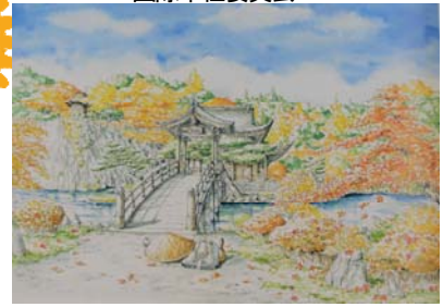
「おなじ星を見ていた - キアリンクスの架かる虹」より 禪 内田 新哉