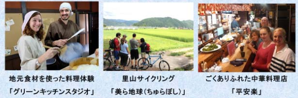
地元食材を使った料理体験 「グリーンキッチンスタジオ」

日本(飛騨高山)を訪れる外国人旅行者が求めるもの・・・ それは、 ありのままの“暮らし”に触れる こと