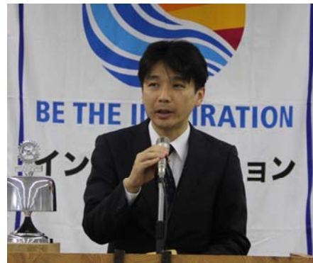
「高山市の挑戦『地方都市における海外戦略の取り組み』 ～行政の決意& 民間の底力～」

平成 11 年 4 月 高山市採用。企画調整部税務課配属。平成 14 年 4 月より企画管理部へ。平成 19 年 4 月には独立行政法人国際観光振興機構国内サービス部へアシスタントマネージャーとして派遣され、その後香港事務所へ研修員として派遣。平成 23 年 4 月に高山市へ戻られ海外戦略室へ。観光課への異動を経て平成 27 年 12 月から外務省大臣官房伊勢志摩サミット準備事務局へ外交実務研修員として派遣、続けてデンバー日本総領事館へ領事として派遣されました。平成 30 年 7 月より高山市海外戦略部海外戦略課係長として活躍しておいでです。どうぞよろしくお願ひいたします。