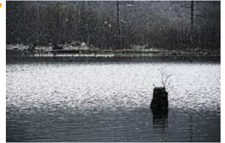
晩冬の大正池 蜘蛛 康介