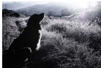
冬の気配 蜘蛛 康介