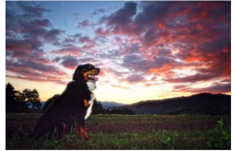
「夏終わる夕焼け」 蜘蛛 康介