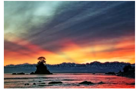
「富山雨晴海岸の朝焼け」 蜘蛛 康介