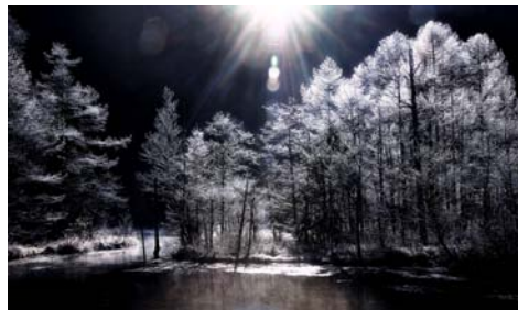
「朝陽差し込む上高地田代池」 蜘蛛 康介