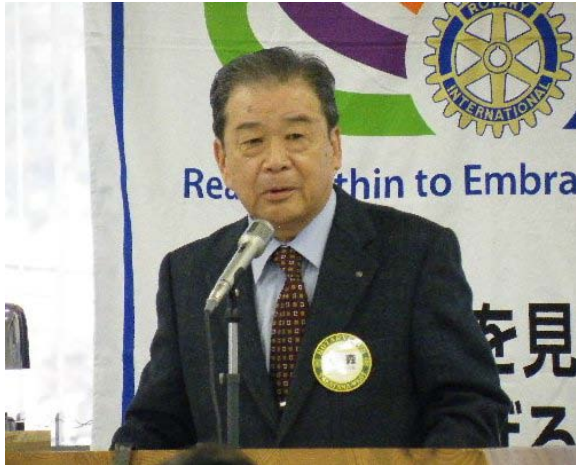
台北東海RCと玉蘭荘について