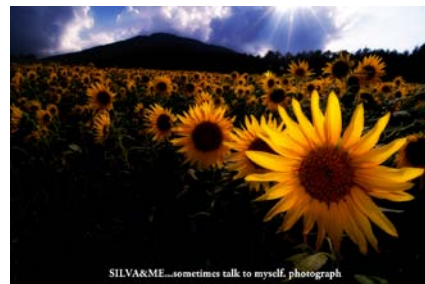
「遅れ咲きのひまわり」 蜘蛛 康介